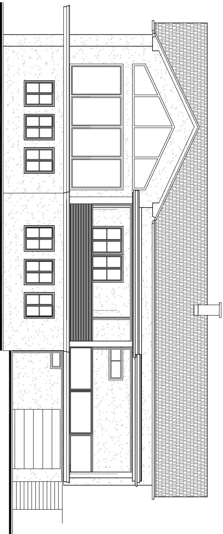
Ansicht Süden Mst 1:100